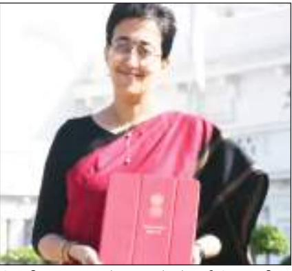
दिल्ली का बजट पेश करने से पूर्व वित्त मंत्री आतिश मीडिया से मुखातिब होते हुई।